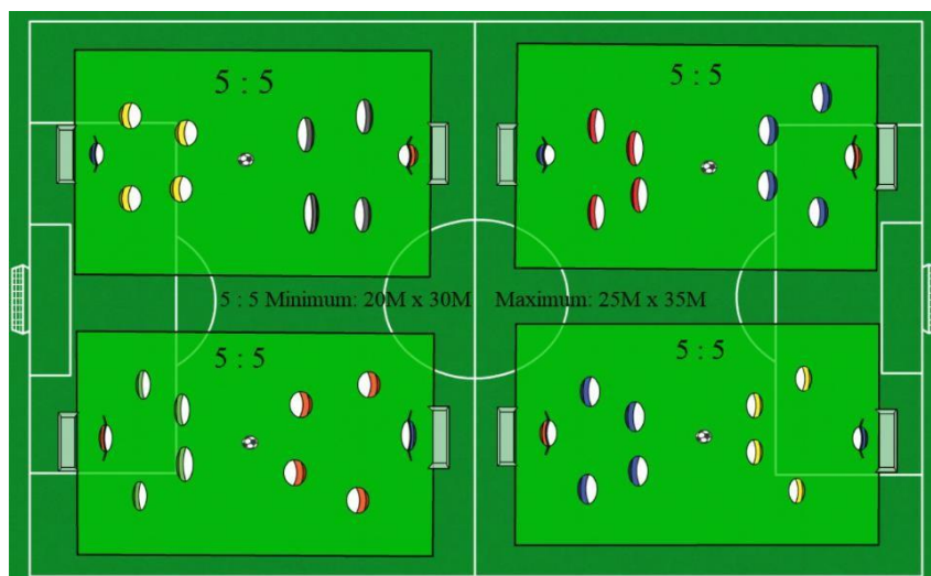
Schema de joc